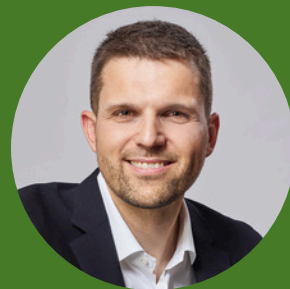
Petr Hladík ministr životního prostředí