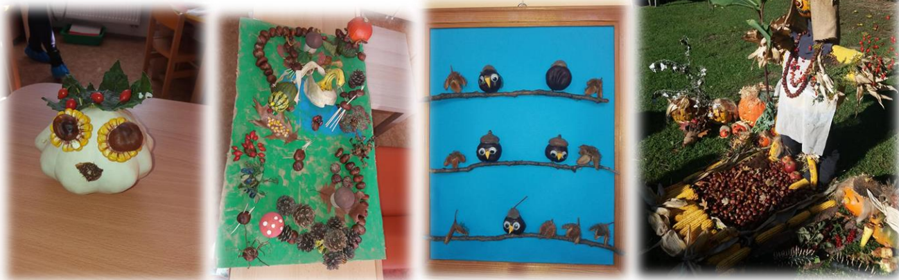
Podzimní výzdoba v MŠ Holandská

11. a 12. října 2021 jsme přivítali návštěvu kolegů z MAP ORP Milevsko II. a jejich pedagogů. Velké díky patří MŠ Holandská a ZŠ Václavské náměstí ve Znojmě , kteří se ujali role hostitelů a provedli pedagogy z Milevska prostorami škol, dopřáli jim velkou dávku inspirace a možnost vzájemného sdílení zkušeností.